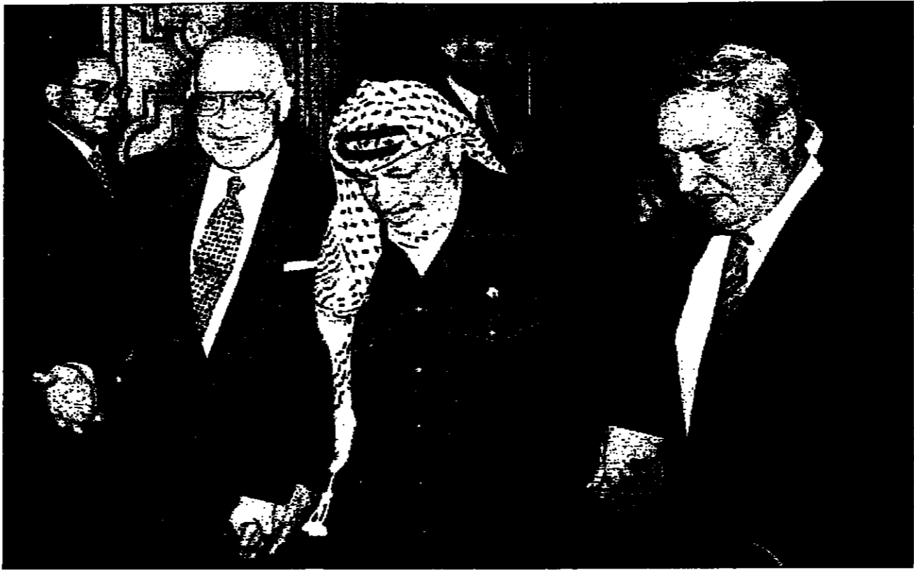
الرئيس الفلسطيني ياسر عرفات مع وزير الخارجية السوري (يمين) والامين العام لجامعة الدول العربية ابي وصالح المشاركة في اجتماع وزراء الخارجية العرب في القاهرة